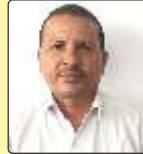
चन्द्र बहादुर डाँगी